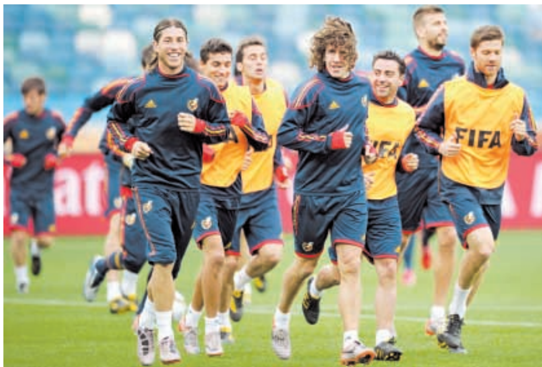
Parte de la plantilla de la selección durante el entrenamiento realizado ayer para preparar el partido de esta tarde contra Suiza

no de El Bao, se ha convertido en paso obligado entre ambas comunidades. Las obras de reconstrucción de la N-634 durarán varios meses. Uno de sus tramos tuvo que ser demolido debido al agua acumulada por las últimas lluvias. » 4 y 5