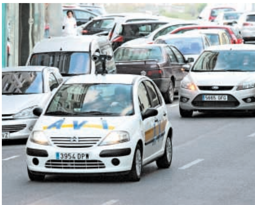
El Automóvil de Vigilancia Inteligente, ayer por la tarde en la zona de Matogrande

El conflicto que rodea al perímetro de seguridad alrededor de la base de la Brilat derivó ayer en un enfrentamiento entre vecinos y policías que concluyó con dos personas heridas leves. El incidente se produjo cuando los participantes en una concentración quisieron acercarse hasta la base. » 6