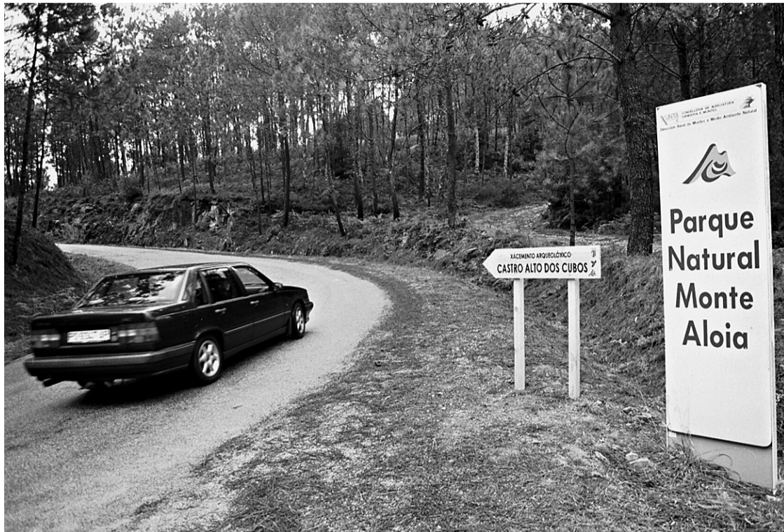
El parque dispone de magníficas vistas y restos arqueológicos de gran valor histórico

A lo largo del actual recinto del parque, que ocupa casi 800 hectáreas, el visitante podrá descubrir cinco miradores, siete molinos de agua a los que