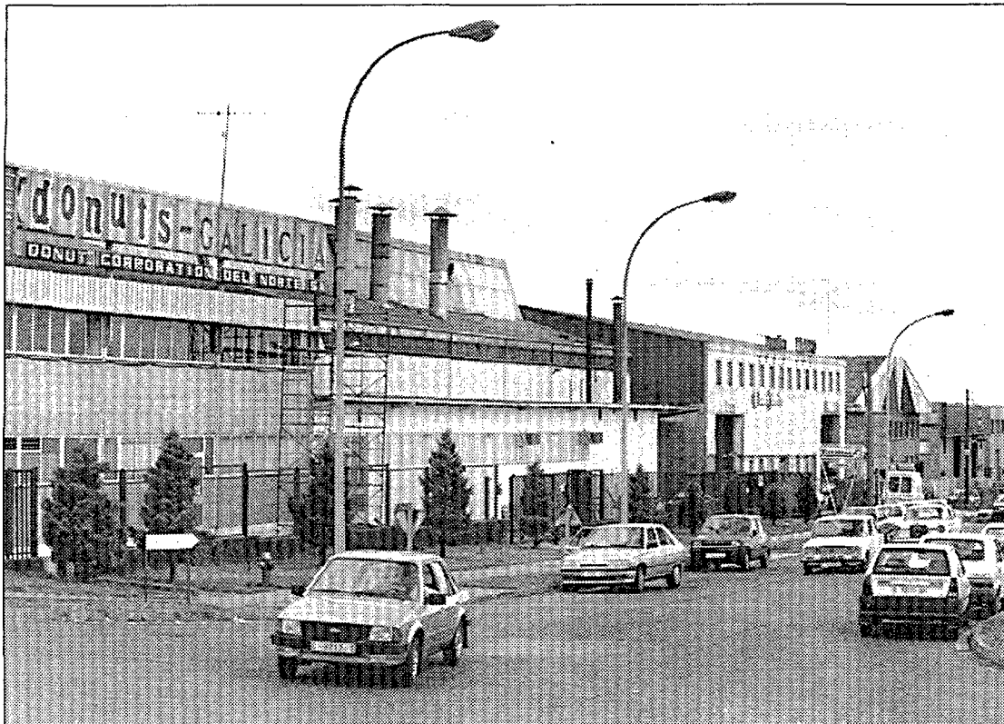
En 1975, Donuts Galicia llevó a cabo la inauguración de sus instalaciones en el santiagués polígono do Tambre