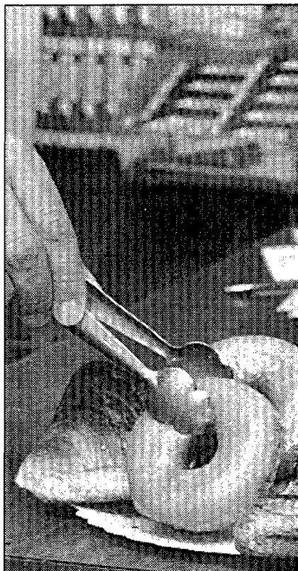
Entre otros productos, Donuts comercializa marcas como «Panrico» y «Bollicao»

A raíz de esta segregación, que responde a una política de descentralización de actividades de la compañía por comunidades autónomas, los resultados después de impuestos presentados en el Registro Mercantil por Donuts Galicia ascendían a más de 90 millones de pesetas en 1991. En dicho ejercicio sus ingresos de la actividad propiamente comercial se situaron en 1.307 millones de pesetas. Pero se debe tener en cuenta que las ventas corresponden sólo a siete meses, debido a que en mayo de ese año cambió la configuración jurídica de la sociedad y, por lo tanto, la estimación contable. A pesar de ello, fuentes de la compañía han asegurado que al cierre del ejercicio de 1992, la facturación en Galicia del grupo ronda los 3.000 millones. La estructura del Grupo Donuts,