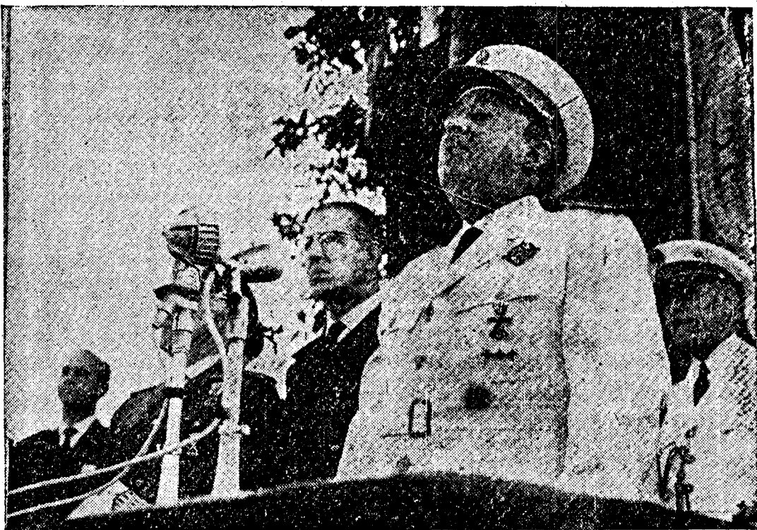
S. E. el Jefe del Estado durante su discurso ante los diez mil labradores concentrados en el valle de la Barcala

España entera vivía en el abandono y en un subconsumo; el pueblo español no consumía lo que otros pueblos del mundo disfrutaban. (Pasa a la página NUEVE)