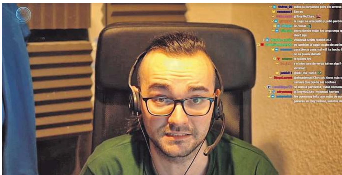
El «streamer» gallego ElXocas, en un directo explicando los problemas de salud mental que le han ocasionado el estrés y la presión en internet.