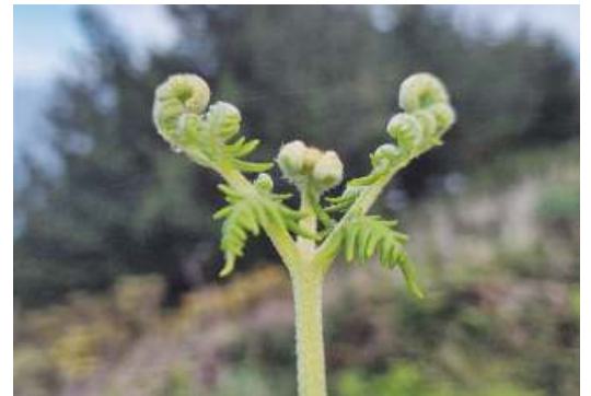
El helecho parece desperezarse por esta época.