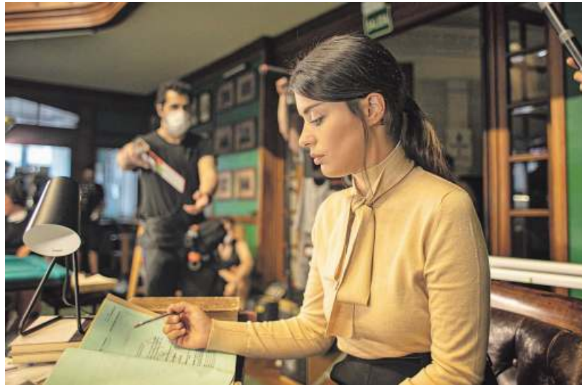
La «influencer» Dulceida (Aida Domènech) en el rodaje de un capítulo de una serie.

A eso se suma la presión que sienten por proyectar una buena imagen, que ven miles y has-