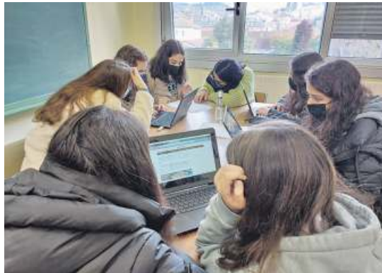
Alumnos del Francisco Aguiar preparando el reportaje.