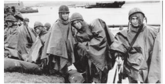
A primeira noticia de La Voz de la Escuela era sobre a guerra das Malvinas. Na imaxe, soldados argentinos.

Los suscriptores pueden acceder a la Hemeroteca de La Voz desde lavozdegalicia.es/hemeroteca/ . Un consejo: para tener éxito en la búsqueda, utiliza los cuadros que permiten acotar las fechas.