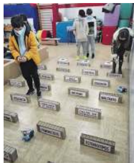
Alumnos xogando o reto robótico polo 8M.

O profesorado do ciclo de primaria deseñou un circuito de xogos relacionados co Día da Muller e un deles foi o denominado reto robótico, no que os alumnos tiñan que dirixir o seu robot