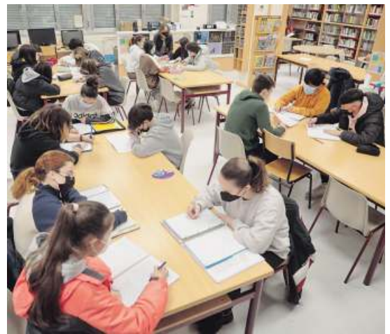
Alumnos do Muralla Romana traballando na reportaxe.

E despois de divertirse lendo o xornal, a experiencia cobra un cariz moito máis interesante cando en vez de estar como lectores, están ao outro lado, como os encargados de facer as noticias.