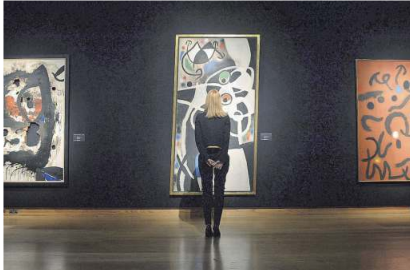
Empleada de la galería Christie's observando un cuadro de Miró que se subastó en el 2014.

¿Adónde van a parar? Aunque puede que haya personas muy ricas interesadas en comprar cuadros, ya sea por gusto o porque creen que pueden revenderlos en el futuro y conseguir más dinero, lo cierto es que muchos de ellos acaban en los pasillos de los museos más importantes del mundo. El Museo del Prado (Madrid),