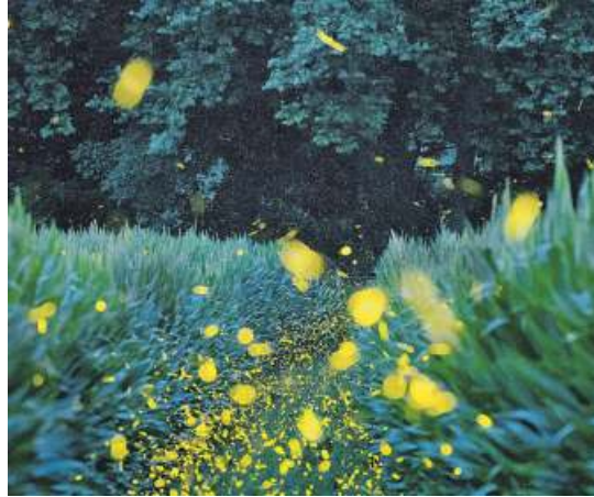
Decenas de luciérnagas en un campo de Gerona.

Desde un punto de vista (bio) químico, la bioluminiscencia se produce mediante una reacción de oxidación en la que el combustible es la luciferina y la luciferasa el catalizador. El color de la luz depende del tipo de luciferina que biosintetice. Una situación equiparable a lo que sucede con las bombillas: todas producen luz, pero dependiendo de qué clase escojas, puede ser blanca o amarilla. Lo que ya no es equiparable es la eficiencia de la reacción: en las reacciones bioluminiscentes, el 98 % de la energía producida es liberada en forma de luz, mientras que en las bombillas tradicionales el rendimiento es menor del 10 % y casi toda la energía se pierde como calor. Además, algunos organismos sin-