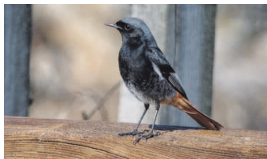
Es uno de los pájaros más fáciles de ver en la ciudad.

Es muy característico. Lo escucharás incluso en pleno invierno y de madrugada. De hecho, las primeras luces del alba, cuando todavía no hay mucho tráfico, son ideales para intentar oírlo incluso desde la ventana de tu casa. Arranca con unos silbidos breves, sigue con una repetición de notas y una especie de