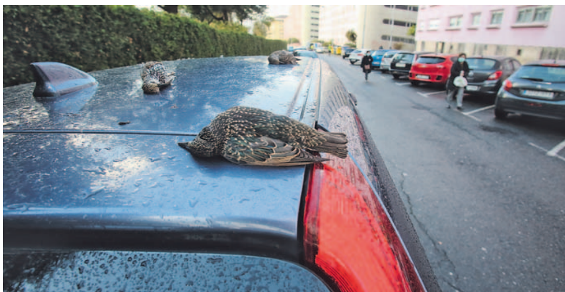
Alguns dos estorniños pintos que caeron mortos sobre a beirarrúa e os coches do barrio ferrolán de Caranza.