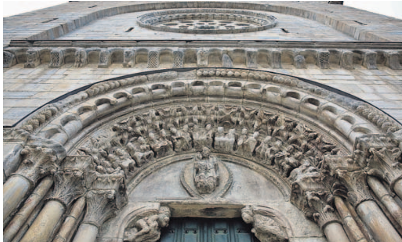
La iglesia de San Xoán en Portomarín es un claro ejemplo de arquitectura y escultura jacobea.

El arte común lo constituyó el románico en sus tres vertientes: arquitectónica, escultórica y pictórica. A la vera de toda la red de caminos jacobeos se fueron construyendo catedrales, basílicas y monasterios (o no tan grandes, como iglesias locales y ermitas) con las mismas técnicas constructivas y los mismos criterios estéticos. En ellos se esculpían estatuas y capiteles con los mis-