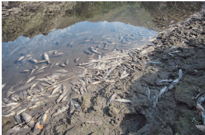
Milleiros de peixes apareceron mortos no 2015 no encoro de Salime, na fronteira con Asturias.

O ano pasado en Colombia morreron de forma repentina dous millóns de abellas nunha zona de colmeas. Aínda que as autoridades non eran quen de atopar unha explicación, os apicultores sinalaron a fumigación da zona