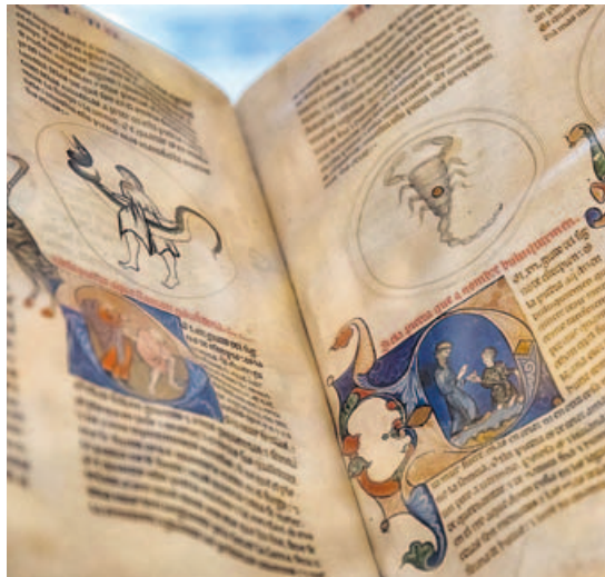
Uno de los códices de Alfonso X el Sabio.

Tuvo el gran acierto de reunir en su corte a un importante grupo de hombres doctos (latinos, he-