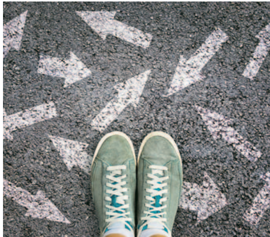
Los jóvenes deben decidir entre muchas opciones de futuro.

La vocación es el deseo, o inclinación, de realizar unas determinadas actividades o proyectos frente a otros, de ejercer una carrera profesional y no otra. Decidimos una actividad porque nos permite realizarnos, nos ha-