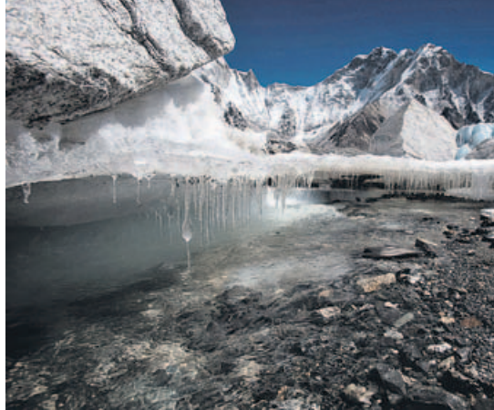
Las consecuencias ya son más que visibles.

El calentamiento del planeta implica no solo que las temperaturas sean más cálidas, sino también la alteración de los complejos sistemas naturales. La ciencia ha podido establecer una relación entre el incremento global de la temperatura y los fenómenos meteorológicos extremos, como olas de calor, fuertes huracanes o intensas precipitaciones que cau-