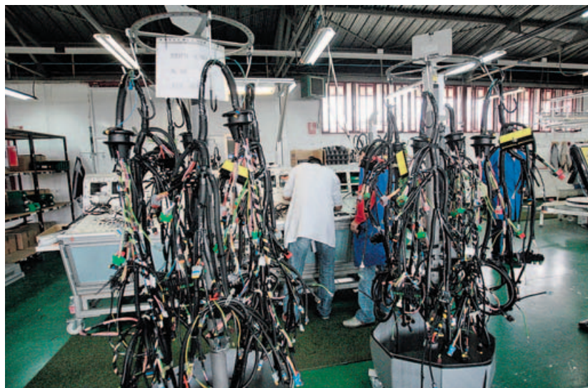
La cárcel en España se enfoca a la reinserción. Taller de cableado en la cárcel de Monterroso. Praderó

Sin embargo, hay otros perfiles más difíciles de reinserir, como el de los violadores. No es que no funcionen los programas con ellos, es que muchos se niegan a