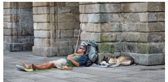
Un peregrino descansando en la plaza del Obradoiro.

Puerta Santa. Para visibilizar de forma solemne y simbólica tanto el comienzo como la duración y el final de cada año santo, la catedral ha establecido el ritual de la Puerta Santa. Los peregrinos que llegan a la basílica compostelana durante el año santo entran en ella a través de una puerta especial que el resto del tiempo per-