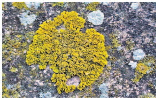
Os liques son das asociacións naturais máis fascinantes.

O micobionte é unha especie de fungo. A súa parte do acordo consiste en obter substancias nutritivas do lugar no que ambos se establecen. O fotobionte é unha alga. O que ela achega é a súa habilidade para realizar a fotosíntese. É dicir, para metabolizar (converter en enerxía) para os dous eses nutrientes. O micobionte consegue auga e protexe o conxunto das condicións atmosféricas