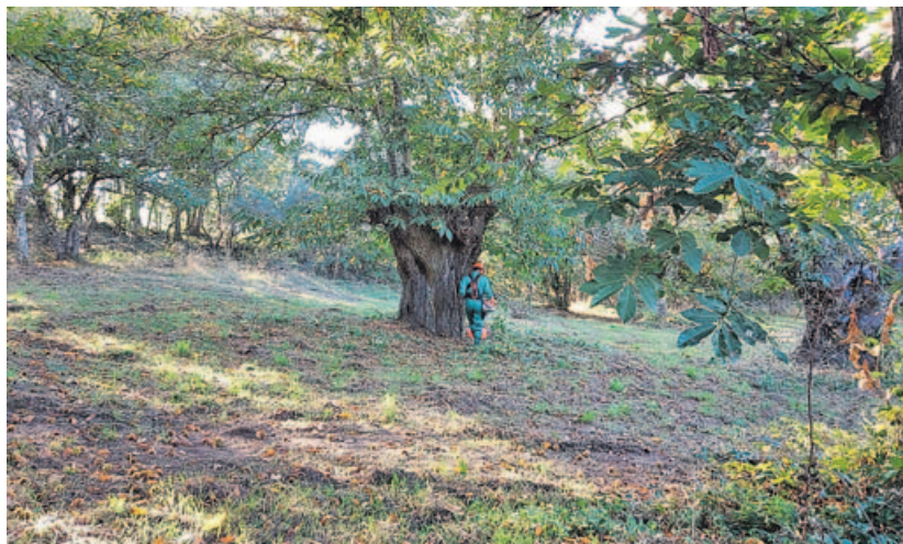
Un dos alumnos do IES Cidade de Antioquía, en Xinzo, realiza tarefas de rozas nun souto.

■ «Violencia de xénero na adolescencia». Un curso de 8 horas para todos os corpos e especialidades. É virtual. O prazo de inscrición remata hoxe. Celébrase este sábado, día 13.