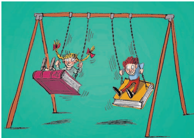
ILUSTRACIÓN PINTO &amp; CHINTO

Porque os obxectivos que, enunciados en infinitivo, enfatizan as programacións didácticas sobre a necesidade de aprender