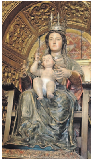
Nuestra Señora de la Victoria, ante la que encomendaron los expedicionarios que darían la primera vuelta al mundo

ciones ante el peligro, era hacer una promesa a la Virgen o a algún santo. Sabemos que Elcano y los tripulantes de la nao Victoria, la única que logró dar la vuelta al mundo, hicieron una promesa a la Virgen durante una tempestad cuando viajaban desde las islas Molucas hacia Timor. Sentían tanto agradecimiento hacia ella que, al llegar a Sevilla, agotados como estaban, lo primero que hicieron fue caminar descalzos en procesión con unas velas hasta la iglesia de Nuestra Señora de la Victoria.