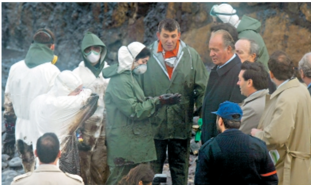
El Rey atiende las explicaciones de una voluntaria que le enseña una muestra del fuel recogido en la playa muxiana de O Coído

El barco expulsado descargó dos veces este año en el puerto coruñés | 2 a 11 y Local