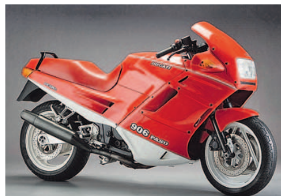
DUCATI PASO (1986) Fabricada en versiones 750 y 900 cc, y nombrada en memoria del piloto fallecido en Monza Renzo Pasolini, la Paso conseguiría renovar la imagen de la marca tras su adquisición por Cagiva.