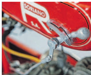
TRES MARCHAS. Era muy normal situar la palanca del cambio junto al depósito, lo que obligaba a soltar la mano del manillar.

dor, fue también uno de los pioneros de la automoción en España. Ya en los primeros años del siglo XX compraba vehículos en Francia y los vendía en Barcelona, una vez que realizaba algunas mejoras. En 1919 construyó su primer vehículo, el Soriano-Pedroso, un deportivo muy ligero que conseguía llegar hasta los 110 km/h, y del que solo se realizaron unas cuantas unidades. También, en esa época, participaba como piloto en diversas carreras de coches, motos