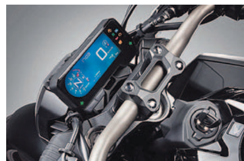
CUADRO DE INSTRUMENTOS DIGITAL. Un indicador de subida de marcha vinculado a las revoluciones informa al piloto de cuándo debe cambiar.

La frenada está perfectamente resuelta, con doble disco delantero de 310 milímetros con pinzas radiales de cuatro pistones y ABS de doble