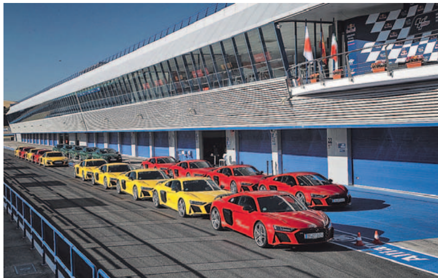
VEHÍCULOS CON ALTO NIVEL TECNOLÓGICO. Audi pone a disposición de los participantes en sus cursos los vehículos más potentes y tecnológicamente dotados de su gama.