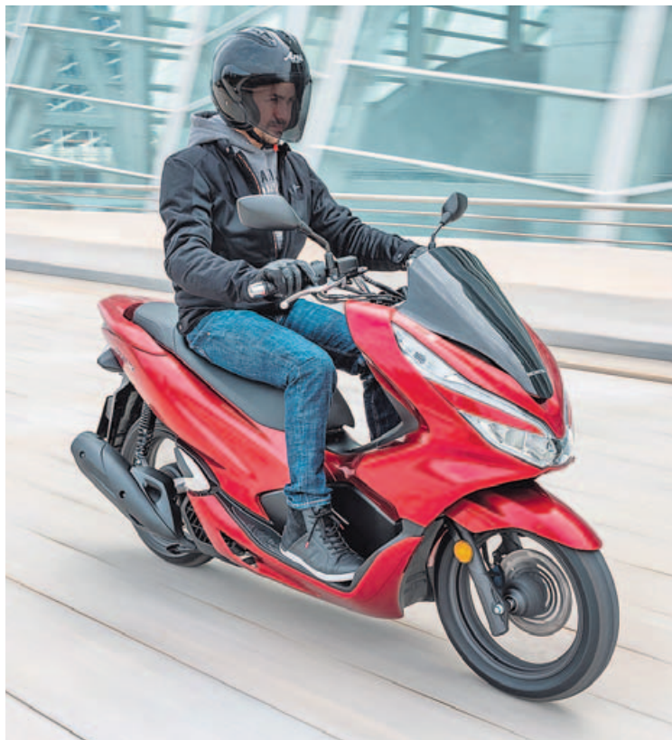
ESCÚTERES DE 125 Y RUEDA ALTA. La Honda PCX 125 es un buen ejemplo de lo que quieren los compradores de motos en Galicia: utilidad y economía.

Por tanto en Galicia hablamos solamente del mercado de particulares, que ha crecido en lo que va de año un 22,9 % tras matricular 2.327 motocicletas de enero a mayo. Es uno de los mayores crecimientos de todas las comunidades españolas, aunque en volumen suponga solo el 10 % de lo