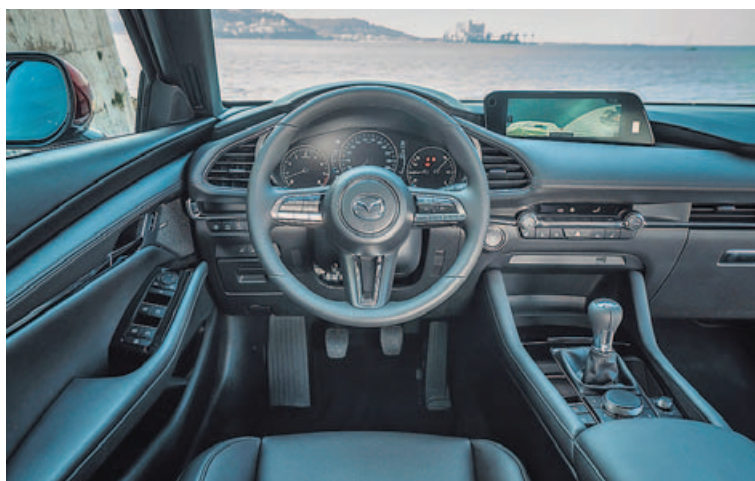
COMBINACIÓN TECNOLÓGICA. El Mazda 3 ofrece los relojes de toda la vida combinados con un «head up display» que proyecta la información en el parabrisas.

Ya en su interior el Mazda 3 ha mejorado mucho la calidad de sus materiales, sobre todo al tacto, con partes