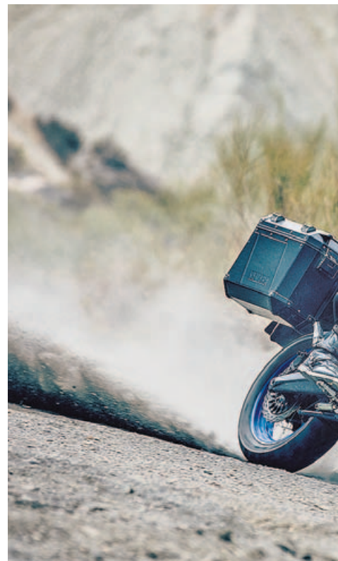
OTRAS TENDENCIAS. Al margen de los escúteres de 125, los gustos de los moteros cambian de las superdeportivas a las trail de viaje y aventura.

Para empezar, el fenómeno de la Honda Scoopy, soportada sobre todo por su éxito en la ciudad de Barcelona, desaparece en Galicia donde es otro modelo de Honda más moderno, el PCX 125, el favorito, compartiendo este éxito con el Kymco Agility City