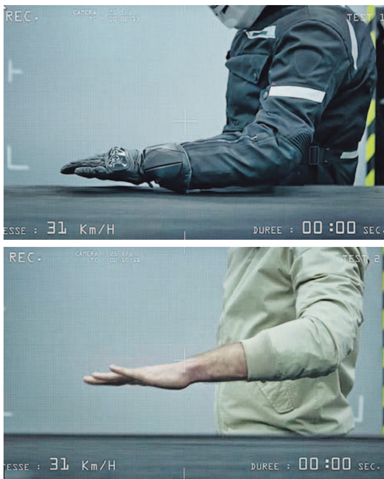
CON PROTECCIÓN Y SIN ELLA. Las fotos son de un vídeo de una campaña francesa de seguridad en moto. Arriba se hace una prueba de rozamiento a 31 km/h con guantes y ropa adecuada. Abajo no hay ninguna protección.

3 ROPA RESISTENTE. Al igual que los guantes, una ropa resistente a la abrasión puede ser la diferencia entre salir ileso de una caída o