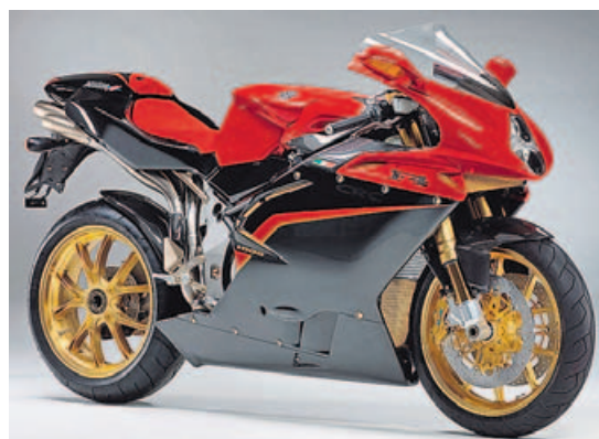
MV AGUSTA F4 (1997) Tras el cambio de propietarios en Ducati, Tamburini continuará con la F4, ahora bajo la marca MV Agusta, la evolución de los modelos que en Ducati había desarrollado hasta la 916.