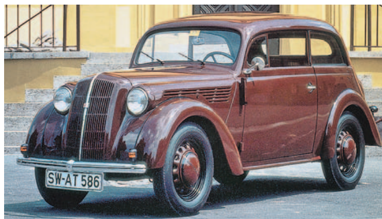
EL PRIMER KADETT DE 1936

En 1909 apareció este modelo, que se hizo muy popular entre los médicos rurales alemanes y que les permitía circular por caminos, hasta las granjas de sus pacientes, o circular por las calles de las grandes urbes con soltura.