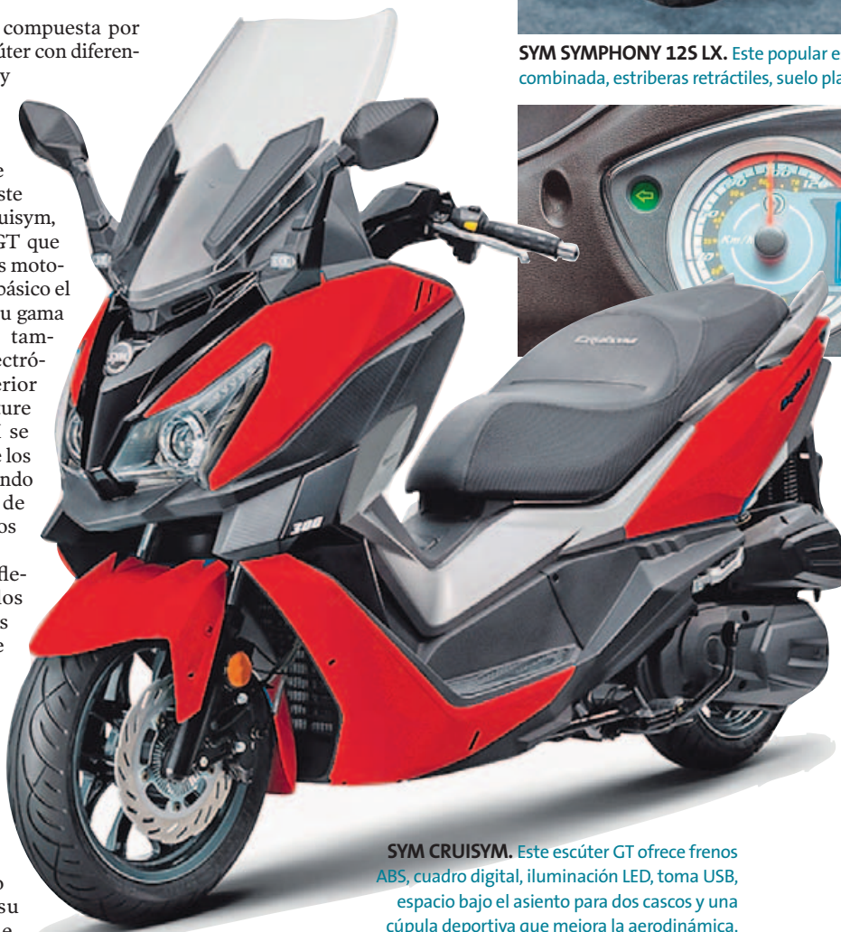
SYM CRUISYM. Este escúter GT ofrece frenos ABS, cuadro digital, iluminación LED, toma USB, espacio bajo el asiento para dos cascos y una cúpula deportiva que mejora la aerodinámica.