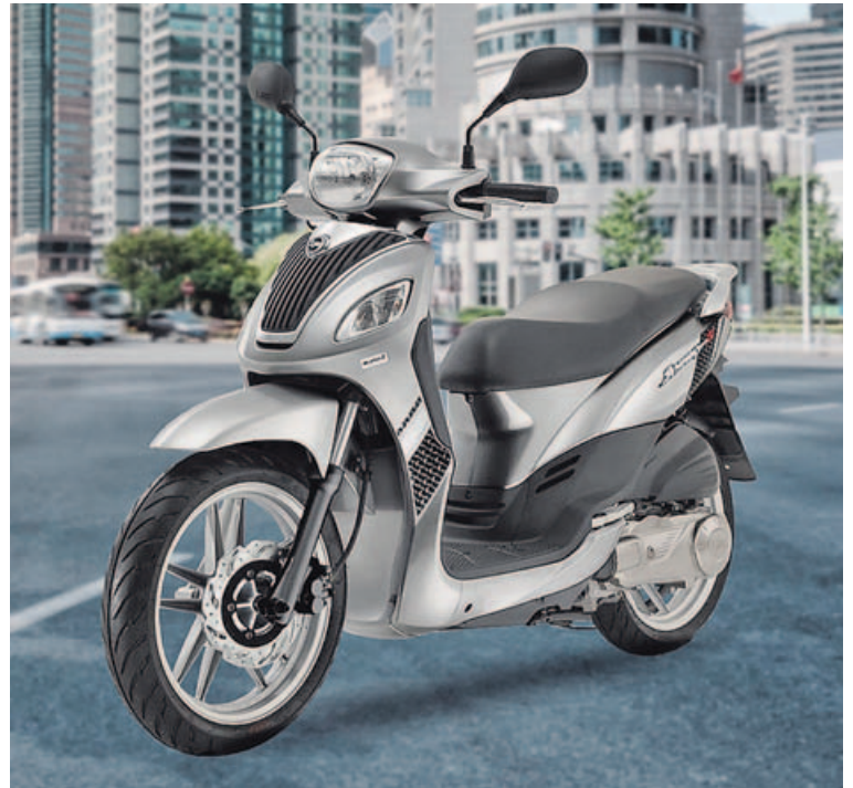
SYM SYMPHONY 125 LX. Este popular escúter de rueda alta dispone de frenada combinada, estriberas retráctiles, suelo plano y cuadro analógico.

líneas redondeadas y sobre todo de colores muy combinados. Su aspecto atemporal esconde bajo la carrocería un motor de 125 centímetros cúbicos y 4 tiempos. Y ya que hablamos de 125 hay que hacerlo del modelo Symphony LX, que con su rueda de 16 pulgadas le otorga un diseño muy esbelto, pero sobre todo un excelente comportamiento ya no solo en carretera sino en las grandes ciudades, donde se maneja con una gran facilidad.