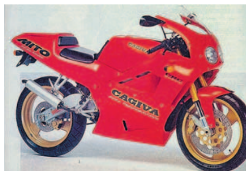
CAGIVA MITO (1989) Cagiva se pasaba del enduro a la carretera con la Aletta Oro y la Freccia, a las que seguiría la Mito, una réplica de 125 cc de la Cagiva 500GP que Randy Mamola utilizaba en competición, también diseñada por Tamburini.