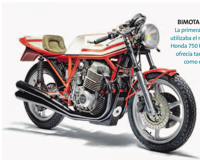
BIMOTA HB1 (1973) La primera Bimota, que utilizaba el motor de una Honda 750 Four, y que se ofrecía tanto completa como en kit para su montaje.