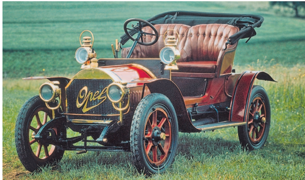
DOKTORWAGEN, EL COCHE DEL MÉDICO

En la historia más reciente de Opel hay también espacio para los deportivos, una generación de vehículos que comenzó con el modelo GT, en 1968, un biplaza con una estilizada línea y soluciones originales como los faros escamoteables, que tuvo mucho éxito, una vez más por su precio aquilatado