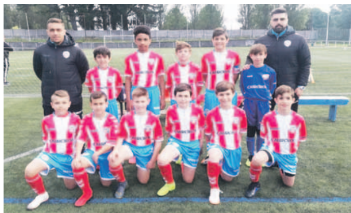
O plantel do CD Lugo antes de debutar no Campionato Galego alevín en Ferrol

POSTO DA RESIDENCIA que perdeu por un a cero ante o Xuventude Oroso, que á postre sería o campión e o equipo clasificado para a fase final alevín