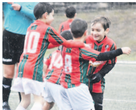
O Rácing Villalbés B, campión do Grupo Final A