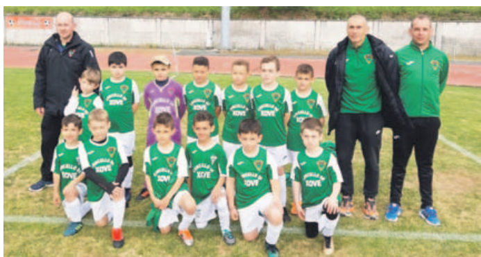
O conxunto prebenxamin do Xove Lago ao completo cos seus adestradores