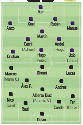
Goles: Carril, Cristian e Hugo polo Compostela. Arbitros: Nicolás Elespe, Brandon Ramos e Alberto Álvarez

Dura derrota do Polvorín no partido de ida da eliminatoria que lle mide co Compostela por un posto na Liga Galega cadete a próxima tempada. Unha derrota que para a maioría dos equipos sería sinónimo de centrarse no camiño máis longo por medio da repesca, pero si un equipo pode conseguir a remontada ese é o