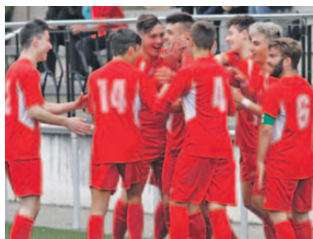
Os xogadores do Castro celebrando un dos goles