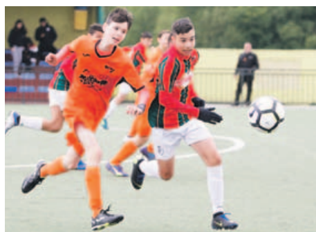
O laranxa Diego e Adrao loitan por un balón dividido

A Piringalla agarda rival tras superar o duelo de oitavos de final ante o Rácing Villalbés B. Os laranxas puxeron o partido de cara nada máis comezar, cun gol de Calderón aos tres minutos de xogo, e deixaron practicamente resolto antes do descanso con catro tantos máis. Tras o paso polos vestiarios,