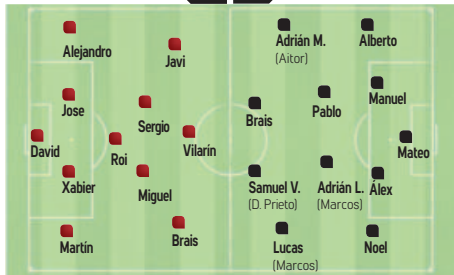
Árbitro: Iago Caoiro Mariño Campo: A Cheda