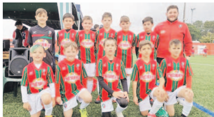
Os xogadores do Villalbés co seu adestrador na fase final disputada en Silleda

As derrotas contra o Deportivo e o Victoria privaron ao campión benxamín, que empatara co Riveira, de entrar nas eliminatorias