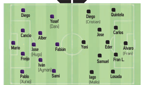
Arbitro: Adrián Estraviz Cerdeira Campo: Rodriguez Lago - As Gándaras (Lugo)