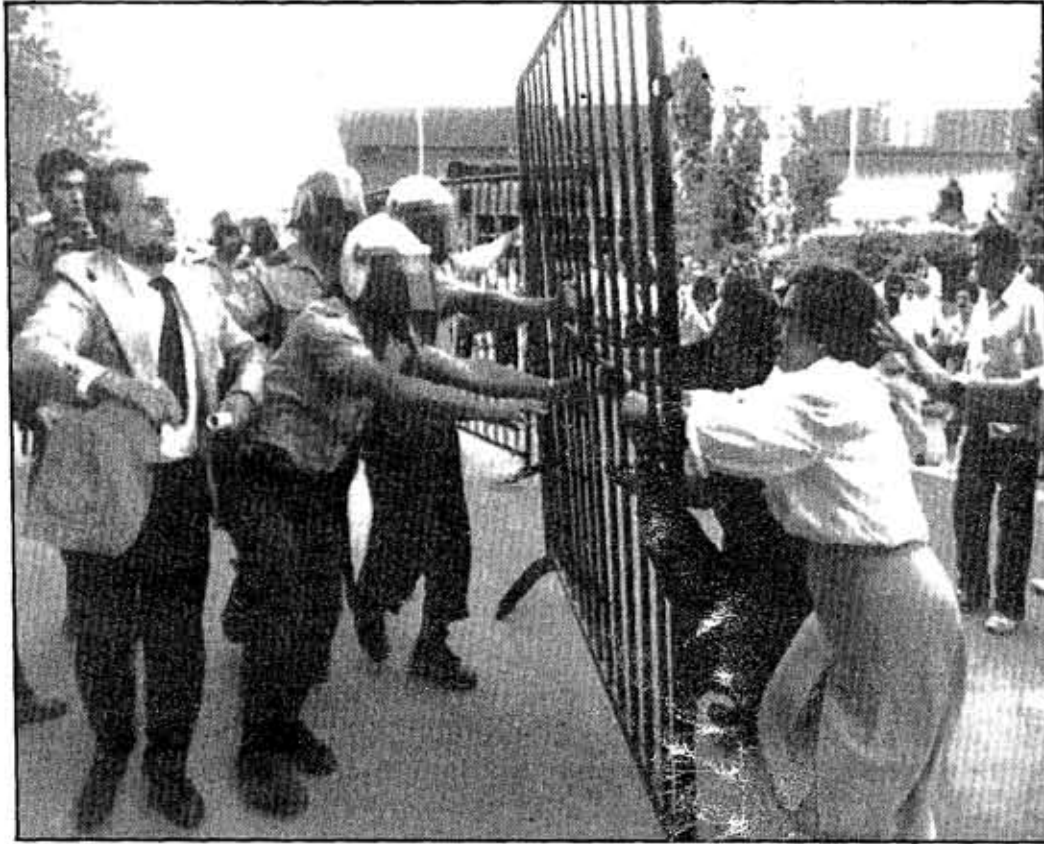
Uno de los abogados del juicio de la colza tuvo que ser protegido por los antidisturbios, ya que afectados por la colza pretendían atacarle tras haber apedreado el autobús que transportaba a los procesados