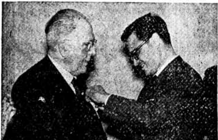
El jefe nacional del S. E. U., en el momento de imponer el Vitor de Plata al director de la Escuela de Altos Estudios Mercantiles, en el acto celebrado en la mañana del domingo en la Jauría provincial del S. E. U.