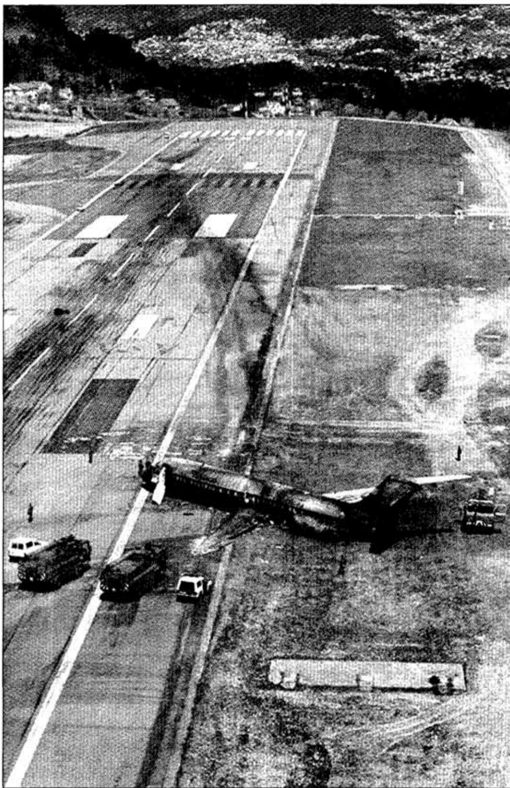
La pista de aterrizaje muestra las huellas del recorrido del avión desde el impacto con el suelo