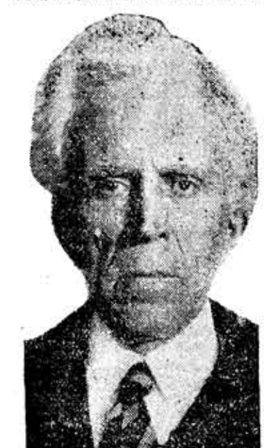
EL SR. PORTELA VALLADARES que ayer dimitió la presidencia del Consejo de ministros