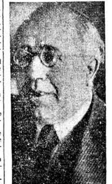
EL SR. AZANA que preside el nuevo Gobierno