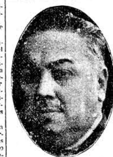
EL SR. MARTINEZ BARRIO que presidirá el nuevo Parlamento