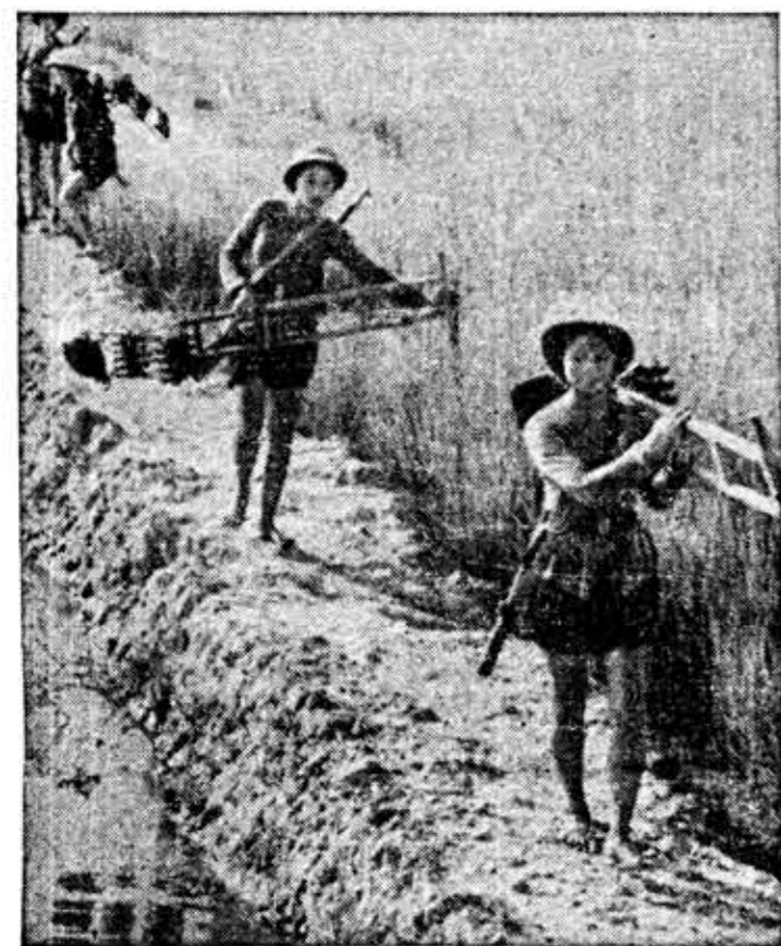
Las milicias del Vietcong no sólo se nutren de hombres. Numerosas mujeres vietnamitas luchan y padecen afrontando todos los riesgos de la guerra. En la fotografía, jóvenes guerrilleras con casco, fusil y descalzas, marchan en busca de nuevas posiciones.

El "Luna IX" aterrizó en el "Mar de las Tormentas" y envía información