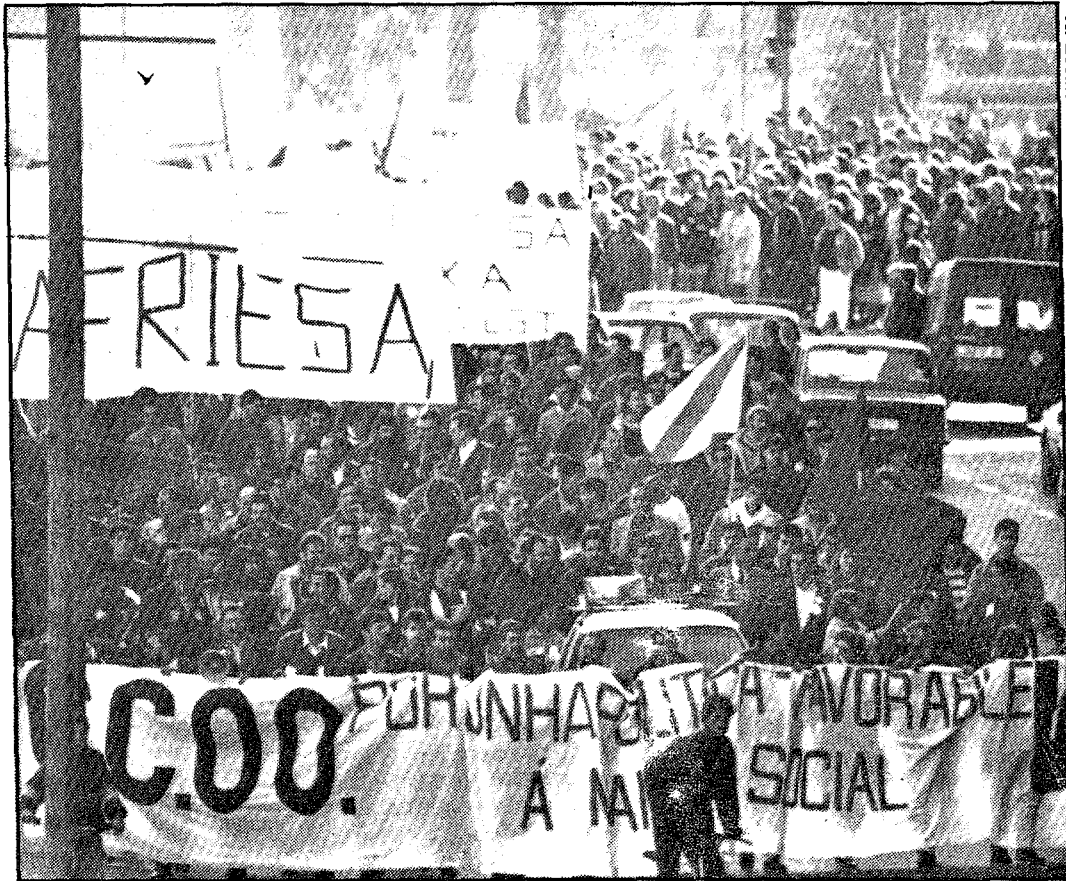
La participación activa en la huelga pudo medirse en las numerosas manifestaciones que se celebraron en España. Las de Vigo, La Coruña —en la fotografía— y Ferrol fueron las más concurridas de Galicia

A medida que se iba conociendo la incidencia de la movilización, los portavoces de los distintos agentes económicos fueron emitiendo sus interpretaciones. Los representantes en Galicia de las centrales convocantes destacaron el ambiente