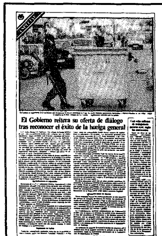
El Gobierno reitera su oferta de diálogo tras reconocer el éxito de la huelga general

Las consecuencias de la jornada de ayer y las propuestas que hoy concretarán las ejecutivas de UGT y CC OO serán analizadas por el Gobierno en el Consejo de Ministros de mañana. Si los sindicatos señalaron como reivindicación no negociable la retirada del Plan de