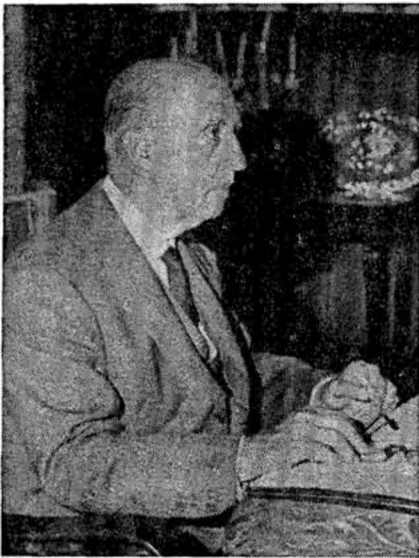
FRANCO PRESIDE EN MEIRAS EL CONSEJO DE MINISTROS: 22 DE AGOSTO DEL AÑO ACTUAL. — (Foto Archivo).