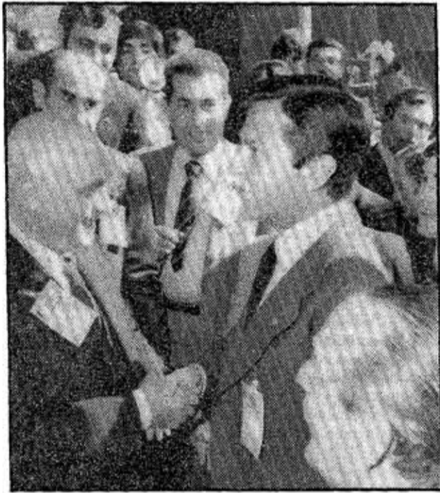
Suárez saluda a Amintore Fanfani, líder demócrata - cristiano italiano, durante un descanso del congreso de UCD.

Al pontevedrés Carballo Blanco no le fue admitida una enmienda en el texto sobre las autonomías Este cita sólo a Cataluña y al País Vasco como nacionalidades que en los pasados siglos fueron despojadas de su personalidad e instituciones