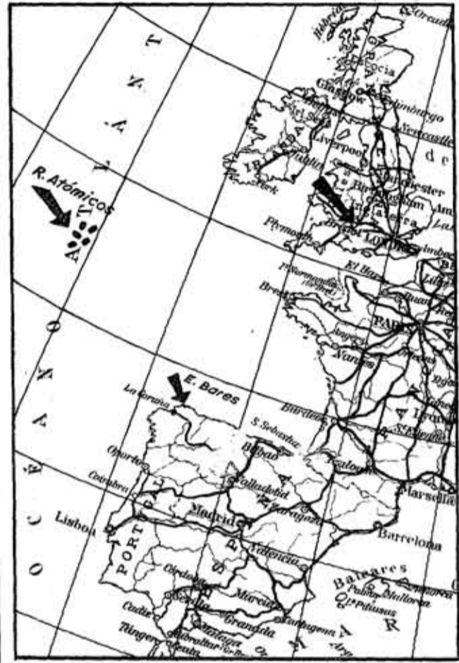
Las flechas señalan el puerto inglés de Bristol, donde carga los bidones de residuos el buque «Gen», el lugar donde son depositados en el Atlántico y la referencia a la Estaca de Bares, hasta donde hay una distancia de unos setecientos kilómetros.