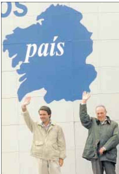
Aznar y Fraga intervinieron ante 15.000 simpatizantes en Monte Faro

Ante más de 15.000 simpatizantes, Manuel Fraga se mostró esperanzado en renovar la confianza de los gallegos en las urnas, mientras el secretario general del PP gallego, Xosé Cuiña, restó importancia a las diferencias sobre las candidaturas del partido diciendo que son «tormentas nun vaso de auga que sempre hai en todas las familias».