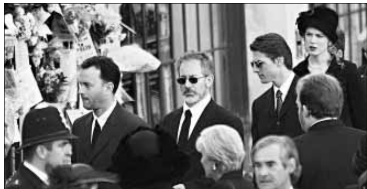
El duque de Edimburgo, el conde Spencer y Carlos de Inglaterra acompañaron a Guillermo y Enrique, que colocaron sobre el ataúd unas flores con una tarjeta manuscrita que decía (mummy) (mamá). A los funerales asistieron los duques de York, la duquesa de Kent y la madre de Diana, (abajo, izquierda), Tom Hanks, Steven Spielberg, Tom Cruise y Nicole Kidman (derecha)

La ceremonia, seguida por media humanidad, batió el récord de audiencia en la historia de la televisión