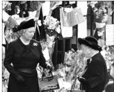
El duro alegato de Spencer fue seguido por las Reina Madre y su hija