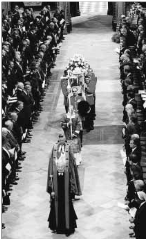
Entrada del cortejo fúnebre en la Abadía de Westminster

delante de Buckingham Palace, toda la Familia Real salió a las puertas del palacio para reverenciar el paso del féretro. En un acto sin precedentes, tras la salida de la Reina del Palacio Real ondeó la bandera británica a media asta, algo reclamado por el pueblo durante los últimos días.