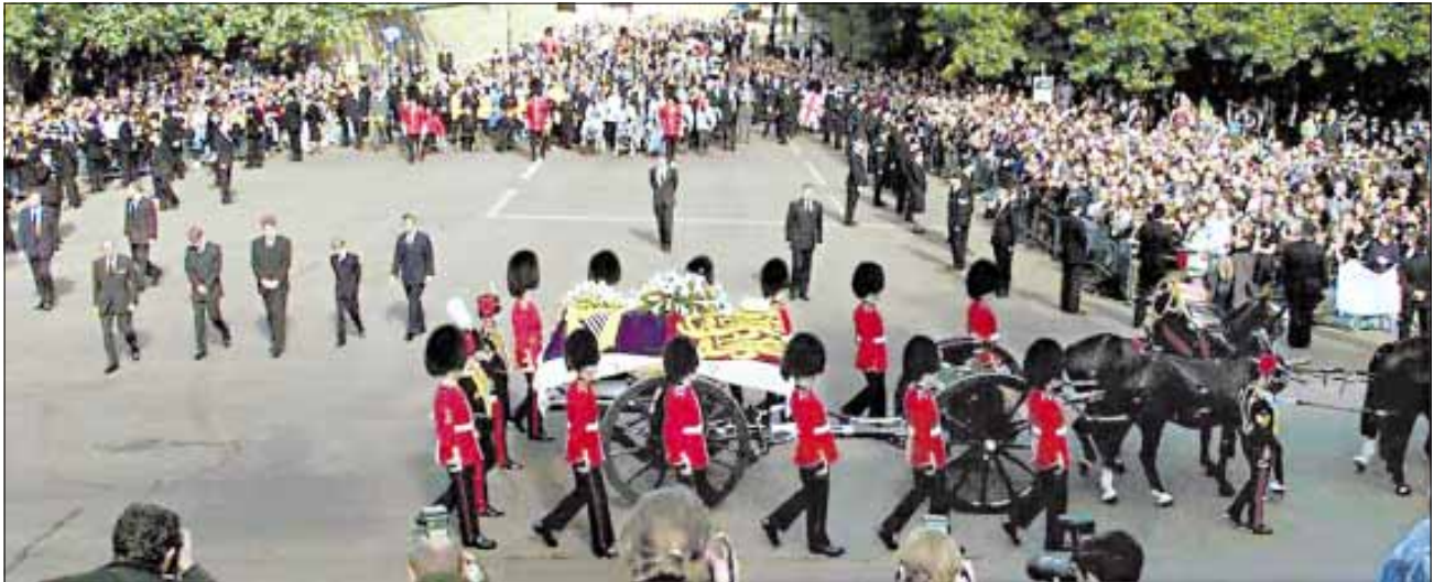
El cortejo fúnebre circula por las calles de Londres custodiado por miembros de la guardia. En él marchan el Príncipe de Gales, sus hijos y representantes de la familia Spencer