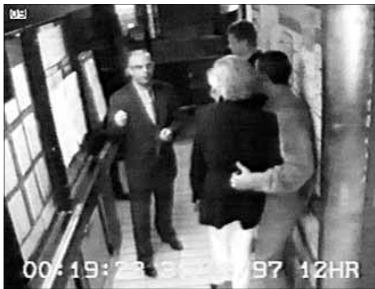
Las cámaras de seguridad del hotel registraron la salida de la pareja antes de sufrir el accidente

Ella le regaló un cortador de puros de oro con el texto «Con amor, de Diana»