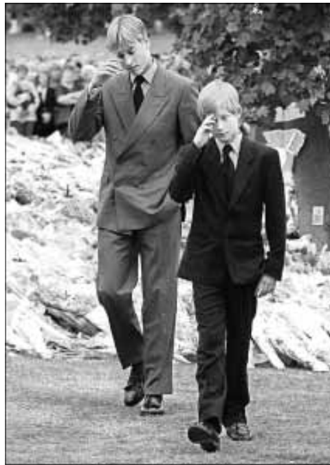
Guillermo y Enrique visitaron Kensington con el Príncipe Carlos

Entre las fotografías incautadas por la policía, una de ellas, tomada justo antes del accidente, muestra al guardaespaldas de Diana, Trevor Rees-Jones, el único superviviente, bajando la visera del parabrisas para protegerse de los flashes de los fotógrafos. Otros diarios ya habían afirmado que el Mercedes 280-S del accidente, había sido robado en abril pasado.