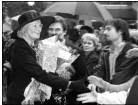
La madre de Diana de Gales, a la salida de la misa de Difuntos