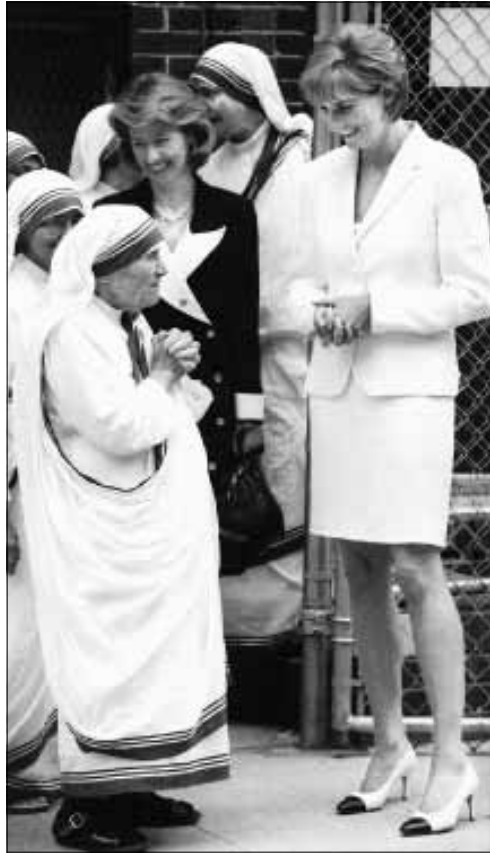
Teresa de Calcuta, que consagró su vida a ayudar a los desfavorecidos, se entrevistó por última vez con Diana de Gales en junio en Nueva York

En el momento de su muerte, la madre Teresa estaba preparando una ceremonia especial que se celebraría con motivo del fallecimiento de la Princesa de Gales, a cuyos funerales en Londres había sido invitada,