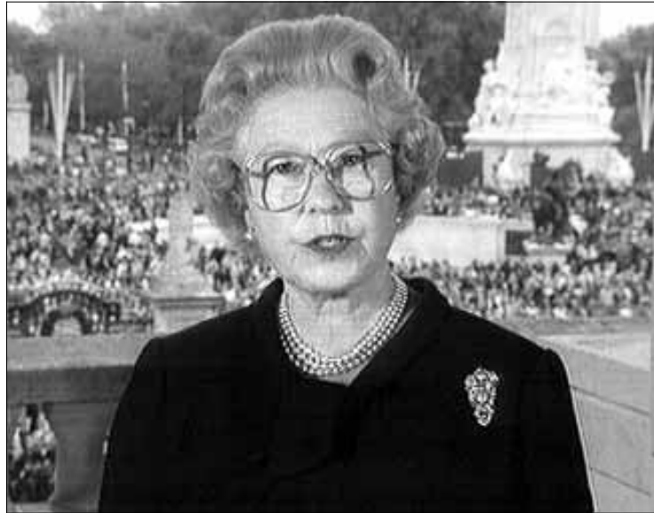
Isabel II se dirigió al pueblo británico al que expresó su simpatía por Lady Di

La Reina finalizó el mensaje señalando que «tenemos la oportunidad de mostrar al mundo —con respecto a la ce-