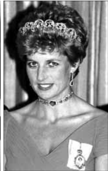
A pesar de la variada colección de joyas que poseía, Diana las lució siempre con gran discreción

den las propiedades de la princesa Diana.