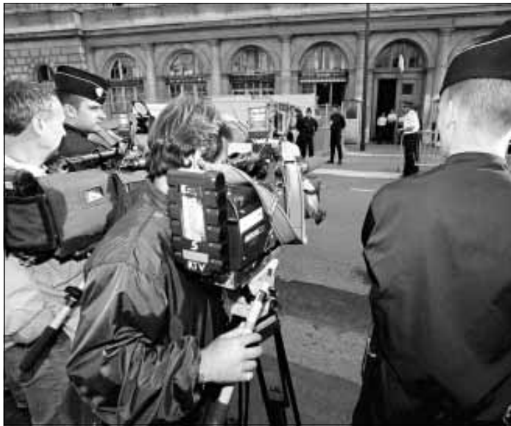
El resultado de las declaraciones de los fotógrafos detenidos era esperado por numerosos medios

En definitiva, advírtese preocupación política e social pola existencia dun problema que reviste importancia e que trabasa un acontecemento moi puntual. Ninguén —ou moi poucos— dúbidan que haxa motivos de sobra para a reflexión e o debate. Mais agora mesmo non se dá o clima idóneo para a elaboración de propostas de actuación que reconduzan comportamentos preocupantes para os defensores dun