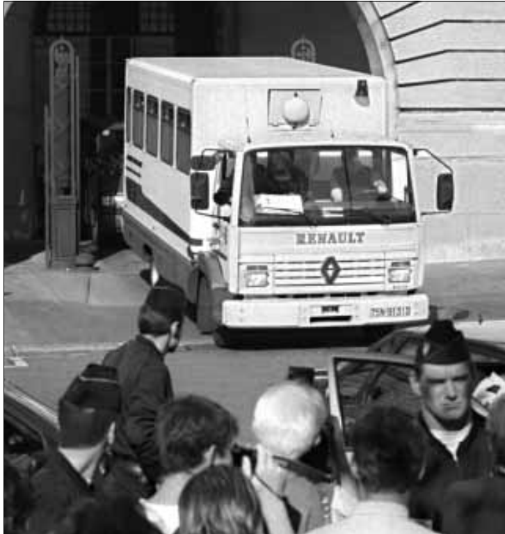
Los siete fotógrafos detenidos fueron trasladados en un furgón a presencia del juez que les tomó declaración