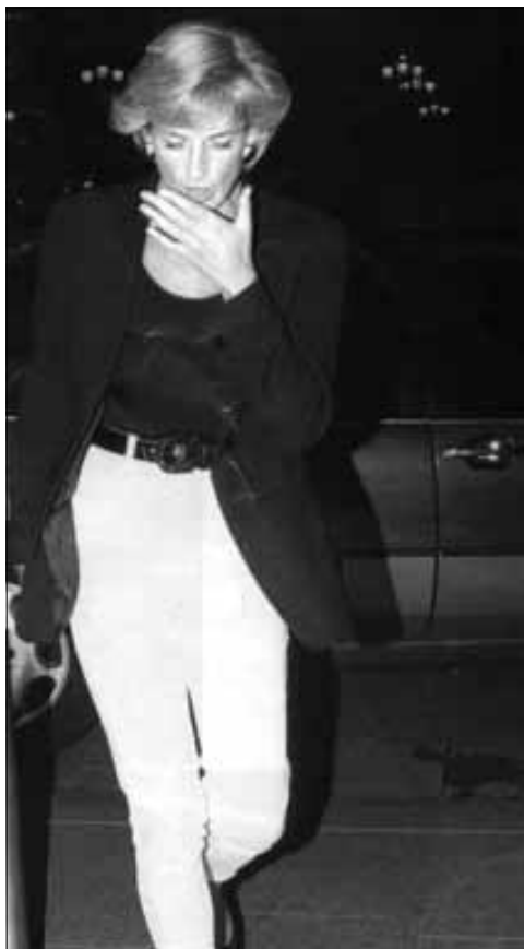
Una de las últimas instantáneas de la Princesa

Estos números extra dedican más de cincuenta páginas con reportajes a color que presentan la vida de la princesa más llorada del Reino Unido.