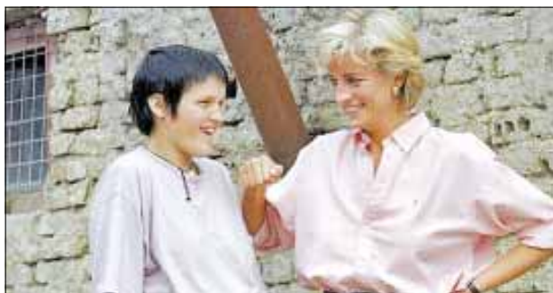
JOHN STILLWELL / ELVIS BARUKTIC / HIDAJET DELIC

Lady Di dedicó buena parte de su tiempo a labores humanitarias, desde campañas contra las minas antipersonales, hasta las visitas a los niños de Bosnia