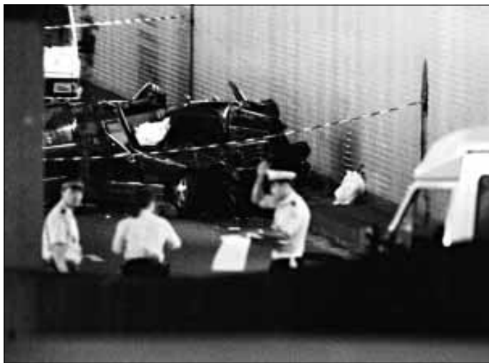
El automóvil, tras el violento choque frontal, quedó totalmente destruido