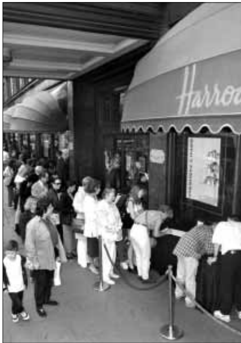
Los almacenes Harrod's cerrarán el sábado, día del funeral de Diana