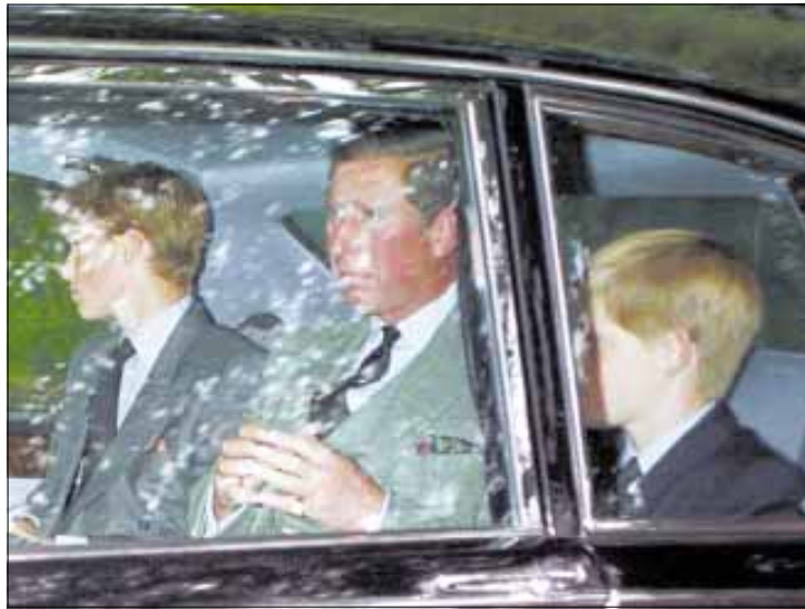
El príncipe Carlos con sus hijos Guillermo (izquierda) y Enrique pocas horas después de conocerse la noticia

Lo fácil sería mantener el actual status quo , una vida como divorciado con una amante que poco a poco tuviera un papel más público. O quizás volverse a casar en un par de años, esta vez con la mujer con la que él siempre quiso pasar el resto de su vida, Camilla. Esta opción, aprobada por el establishment y por la Iglesia, no lo sería por el pueblo. Sin duda encontraría cierta oposición por parte de su hijo mayor, Guillermo, íntimamente