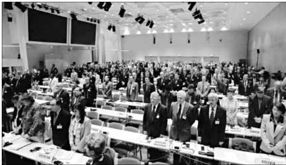
Los miembros de las delegaciones de los 120 países que asisten en Oslo a la conferencia sobre minas antipersonales guardaron un minuto de silencio

● Pésame del Papa a la reina Isabel. El Papa envió ayer sus «profundas condolencias» a la Reina Isabel tras la muerte de la Princesa Diana, en un telegrama enviado al primado católico de Inglaterra, Basil Hume.