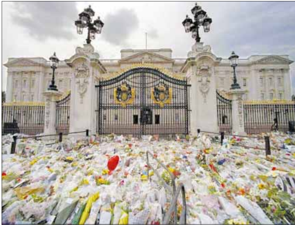
Decenas de miles de flores fueron depositadas ante la puerta principal del Palacio de Buckingham